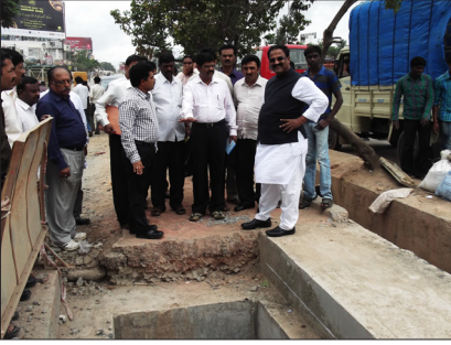
ಮಾರತ್‌ಹಳ್ಳಿ ಸೇತುವೆ ಬಳಿ ಕಾಮಗಾರಿ ಪರಿವೀಕ್ಷಣೆ