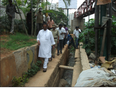
ಮುನ್ನೆಕೊಳಾಲು ಸೇತುವೆ ಬಳಿ ಕಾಮಗಾರಿ ವೀಕ್ಷಣೆ