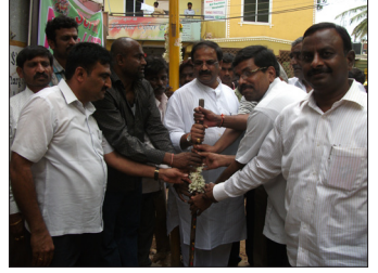
ತುಳಸಿ ಚಿತ್ರಮಂದಿರದ ಬಳಿಯ ರಸ್ತೆ ಕಾಮಗಾರಿಗಳಿಗೆ ಗುದ್ದಲಿ ಪೂಜೆ