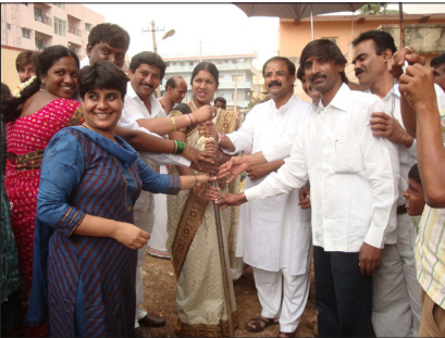
ಮಾರತ್‌ಹಳ್ಳಿ ರಸ್ತೆ ಕಾಮಗಾರಿಗಳಿಗೆ ಚಾಲನೆ