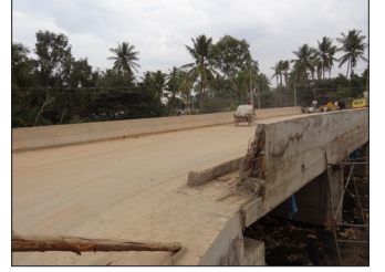
ಬೆಳ್ಳಂದೂರು ಕೆರೆಗೆ ಯಮಲೂರು ಬಳಿ ಸೇತುವೆ ನಿರ್ಮಾಣ