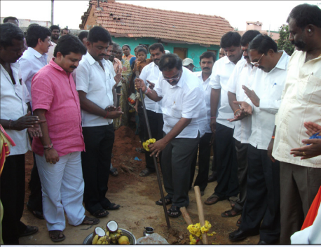
ಅಭಿವೃದ್ಧಿ ಕಾಮಗಾರಿಗಳಿಗೆ ಚಾಲನೆ