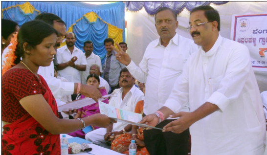
ಆವಲಹಳ್ಳಿ ಫಲಾನುಭವಿಗಳಿಗೆ ಸವಲತ್ತು ವಿತರಣೆ