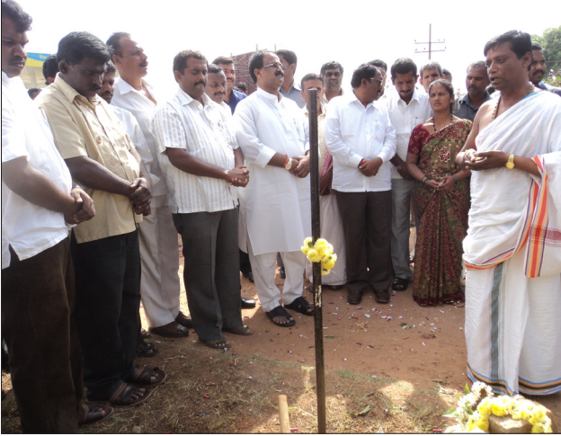
ಭೂಮಿಪೂಜೆ ಮೂಲಕ ಅಭಿವೃದ್ಧಿ ಕಾಮಗಾರಿಗೆ ಚಾಲನೆ

ಕೊಡತಿ ಗ್ರಾಮದಿಂದ ಕಮ್ಮಸಂದ್ರ ಗಡಿಯವರೆಗೆ ರಸ್ತೆ