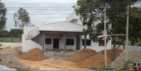
ಬಂಡಾಪುರದಲ್ಲಿ ನಿರ್ಮಾಣವಾಗುತ್ತಿರುವ ಆವಲಹಳ್ಳಿ ಪೊಲೀಸ್ ಠಾಣೆ