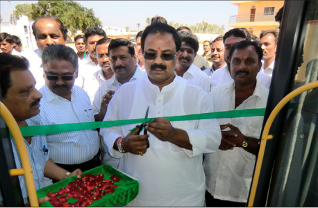
ಹಾಡೋಸಿದ್ಧಾಪುರಕ್ಕೆ ಸಂಪರ್ಕ ಕಲ್ಪಿಸುವ ಹೊಸ ಬಸ್ ಮಾರ್ಗಕ್ಕೆ ಚಾಲನೆ