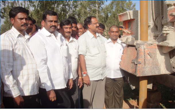
ಜನ್ಮಸಂದ್ರ ಕೊಳವೆ ಬಾವಿ ಕಾಮಗಾರಿ ವೀಕ್ಷಣೆ