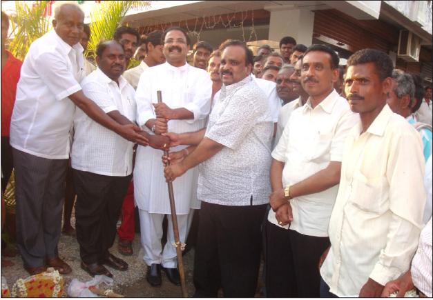
ಕೈಕೊಂಡರಹಳ್ಳಿಯಲ್ಲಿ ರಸ್ತೆ ಕಾಮಗಾರಿಗಳಿಗೆ ಚಾಲನೆ