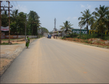
ಸರ್ಜಾಪುರ ರಸ್ತೆಯಿಂದ ದೊಡ್ಡಕನ್ನಲ್ಲಿ ಗೇರ್ ಕಾಲೇಜು ಮಾರ್ಗ ಹೊರವರ್ತುಲ ರಸ್ತೆ ಸೇರುವ ರಸ್ತೆ