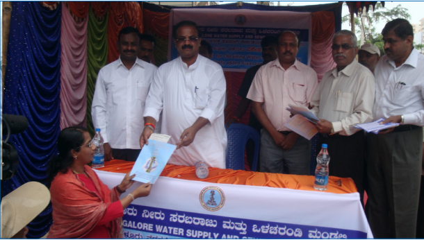
ಬಿಡಬ್ಬು ಎಸ್‌ಎಸ್‌ಬಿ ಕಾವೇರಿ ನೀರು ಸರಬರಾಜಿಗೆ ಅರ್ಜಿ ವಿತರಣೆ