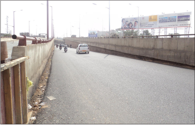
ಬೆಳ್ಳಂದೂರಿನ ಫ್ಲೈ ಓವರ್