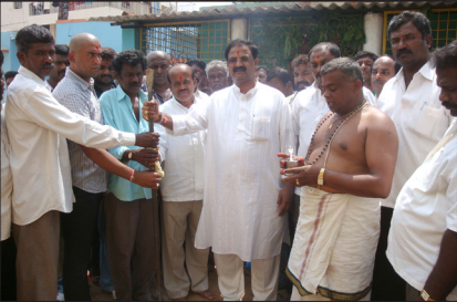
ರಾಮಗೊಂಡನಹಳ್ಳಿ ರಸ್ತೆ ಕಾಮಗಾರಿಗಳಿಗೆ ಚಾಲನೆ