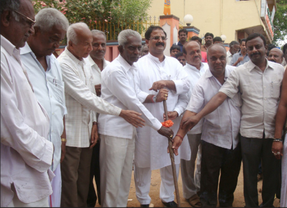
ಇಮ್ಮಡಿಹಳ್ಳಿ ರಸ್ತೆ ಕಾಮಗಾರಿಗಳಿಗೆ ಚಾಲನೆ