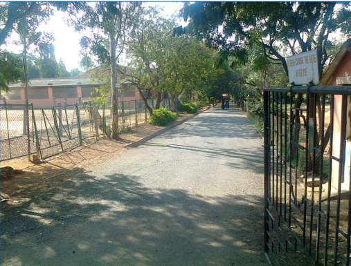
ಸೇಂಟ್ ಜೋಸೆಫ್ ಕಾಲೇಜು ರಸ್ತೆ