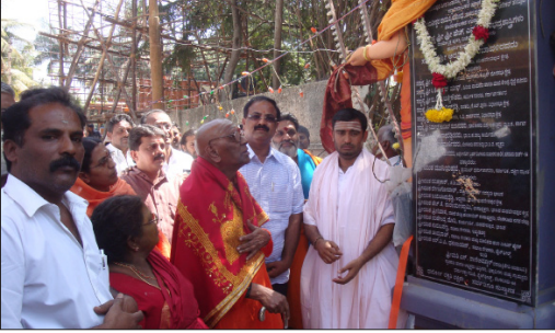
ಬಹುದಿನಗಳಿಂದ ಬಾಕಿ ಇದ್ದ ಕರುಮಾಯಿಮ್ಮ ದೇವಸ್ಥಾನದ ರಸ್ತೆಗೆ ದ್ವಾರ ನಿರ್ಮಾಣ