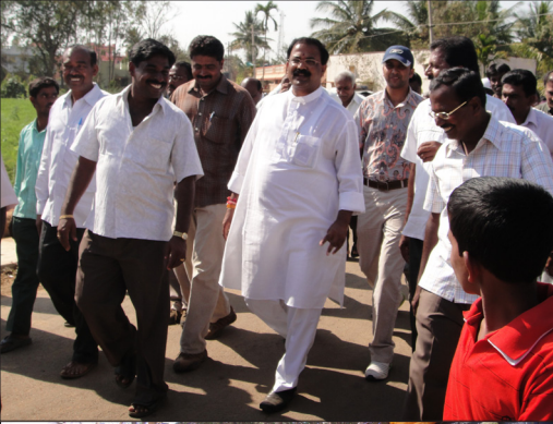
ಅಭಿವೃದ್ಧಿ ಕಾಮಗಾರಿಗಳ ಪರಿಶೀಲನೆ