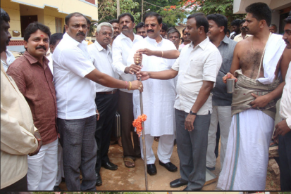
ಹಗದೂರು ರಸ್ತೆ ಕಾಮಗಾರಿಗಳಿಗೆ ಚಾಲನೆ