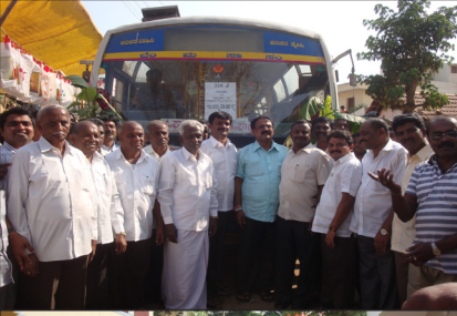
ಇಮ್ಮಡಿಹಳ್ಳಿಗೆ ಬಂದ ಬಸ್