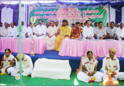
ಬೆಳತ್ತೂರು ಗ್ರಾಮದಲ್ಲಿ ಉಚಿತ ಸಾಮೂಹಿಕ ವಿವಾಹ ಕಾರ್ಯಕ್ರಮ