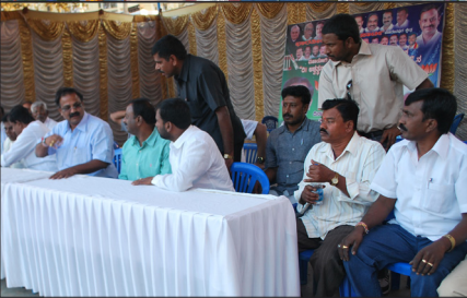
ಗರುಡಾಚಾರ್ ಅಂಬೇಡ್ಕರ್ ನಗರದಲ್ಲಿ ಕುಂದುಕೊರತೆ ಸಮಾಲೋಚನೆ