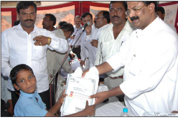
ಬಿಳಿಶಿವಾಲೆ ಸರ್ಕಾರಿ ಶಾಲೆಯಲ್ಲಿ ಪ್ರಶಸ್ತಿಪತ್ರಗಳ ವಿತರಣೆ