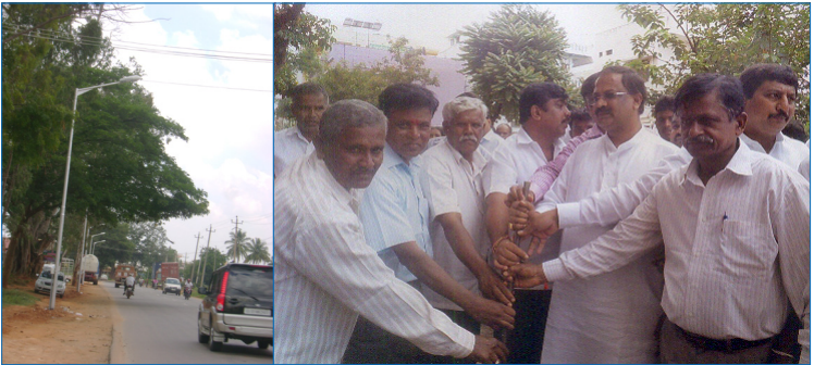
ಕಾಡುಗೋಡಿ - ಬೆಳತ್ತೂರು ಬೀದಿ ದೀಪಗಳ ನೋಟ