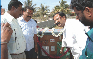
ವಾರಣಾಸಿ ಕುಡಿಯುವ ನೀರು ಸರಬರಾಜಿಗೆ ಚಾಲನೆ