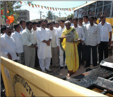
ಬೈರತಿ ಆವಲಹಳ್ಳಿ ರಸ್ತೆಗೆ ಪೂಜೆ