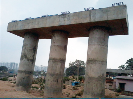
ಹೂಡಿ ರೈಲ್ವೆ ಮೇಲುಸೇತುವೆ ನಿರ್ಮಾಣ ಪ್ರಗತಿಯಲ್ಲಿದೆ.