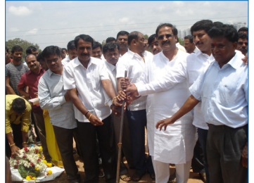
ಓಂ ರಸಿಡೆನ್ಸಿ ಲೇ ಔಟ್, ತಿಗಳರ ಪಾಳ್ಯ ಮತ್ತು ಕೊಡಿಗೆಹಳ್ಳಿಗಳಲ್ಲಿ ವಿವಿಧ ಅಭಿವೃದ್ಧಿ ಕಾಮಗಾರಿಗಳಿಗೆ ಚಾಲನೆ