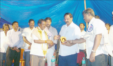
ಸಾದರ ಮಂಗಲ ಕಾರ್ಯಕ್ರಮದಲ್ಲಿ ಹಕ್ಕುಪತ್ರ ವಿತರಣೆ